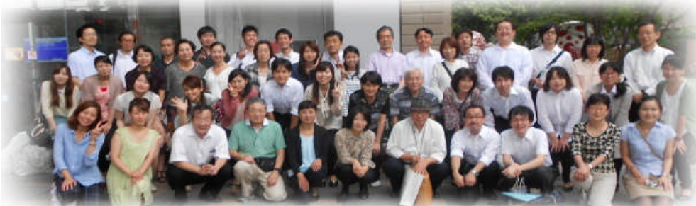
平成26年9月6日「第7回夏の思い出コンサート」にて